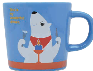
0243004 APOC マグ シロクマ シンプルな幸福