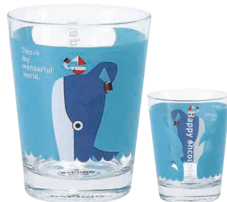
0243102 APOC グラス クジラ 幸福な出会い