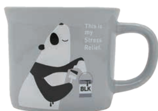
0243002 APOC マグ パンダ 変身願望 4516657218690