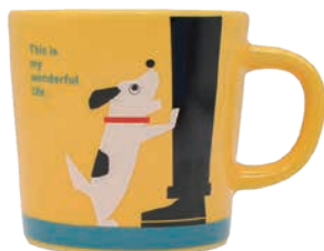
0243003 APOC マグ イヌ かけがえのない存在 4516657218706