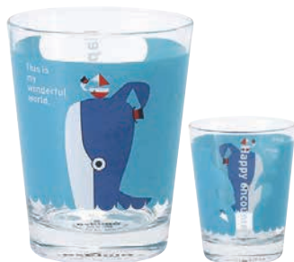
0243102 APOC グラス クジラ 幸福な出会い 4516657218751