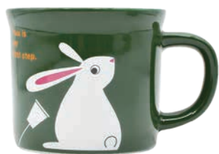
0243001 APOC マグ ウサギ 積極的な聞き方 4516657218683