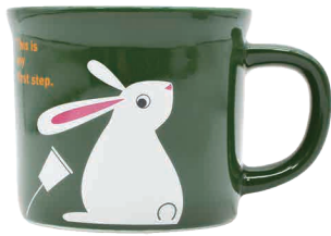
0243001 APOC マグ ウサギ 積極的な聞き方