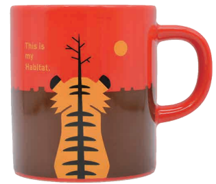
0243005 APOC マグ トラ 森林破壊