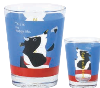
0243103 APOC グラス ウシ 自給自足 4516657218768

¥1,800 (税込 ¥1,980) 約φ8.6×H10.7cm 1入(トムソン) 360ml 日本製/ソーダ硝子