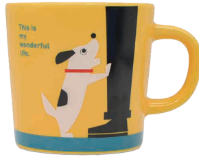
0243003 APOC マグ イヌ かけがえない存在