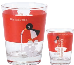
0243101 APOC グラス ペンギン 環境整備 4516657218744