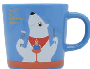
0243004 APOC マグ シロクマ シンプルな幸福 4516657218713