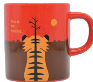
0243005 APOC マグ トラ 森林破壊 4516657218720