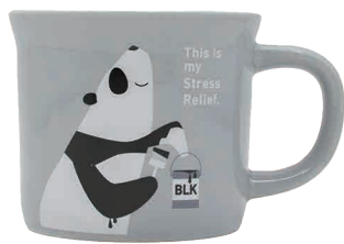
0243002 APOC マグ パンダ 変身願望