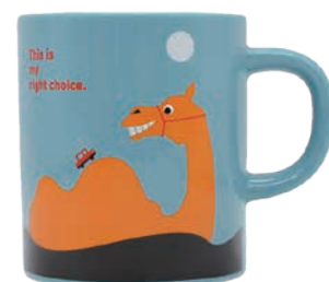
0243006 APOC マグ ラクダ 交通の手段 4516657218737