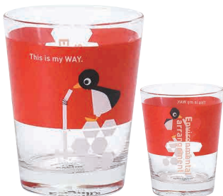
0243101 APOC グラス ペンギン 環境整備