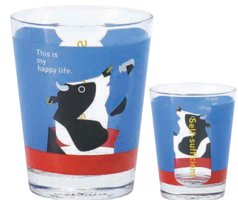
0243103 APOC グラス ウシ 自給自足

¥1,800 (税込 ¥1,980) 約φ8.6×H10.7cm 1入(トムソン) 360ml 日本製/ソーダ硝子