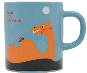
0243006 APOC マグ ラクダ 交通の手段